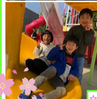
☆外遊びが大好きです☆