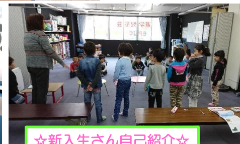
☆新入生さん自己紹介☆