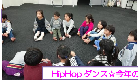
HipHop ダンス☆今年の目標を発表しました