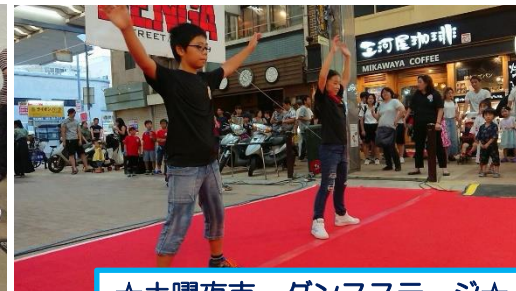
☆土曜夜市 ダンスステージ☆