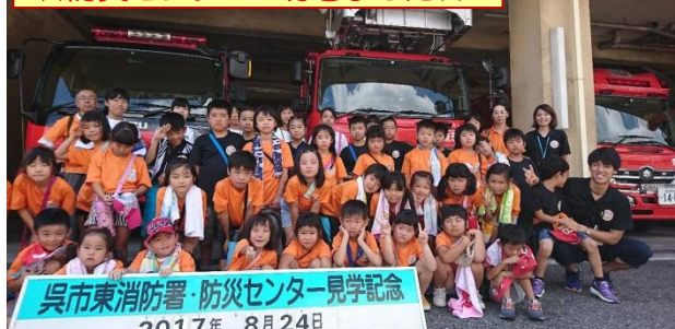
呉市東消防署・防災センター見学記念 2017年 8月24日