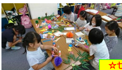
☆七夕飾りができました☆