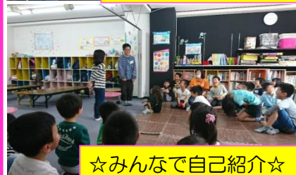
☆みんなで自己紹介☆