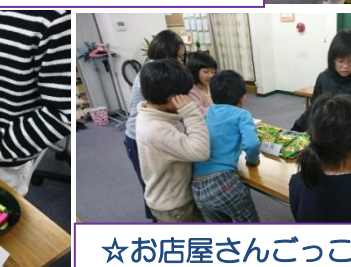
☆お店屋さんごっこ☆