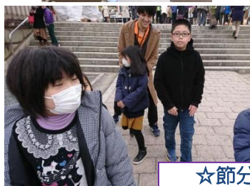
☆節分・亀山神社参拝☆