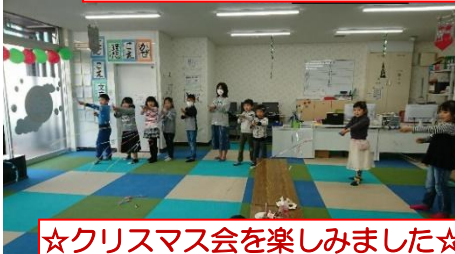
☆クリスマス会を楽しみました☆