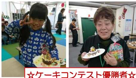
☆ケーキコンテスト優勝者☆