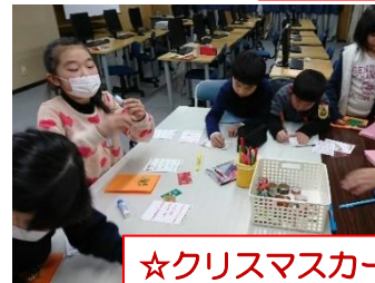
☆クリスマスカード&新年の目標☆