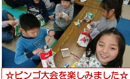
☆ビンゴ大会を楽しみました☆