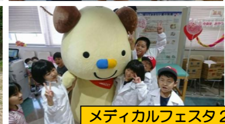
メディカルフェスタ 2017 に参加しました♪